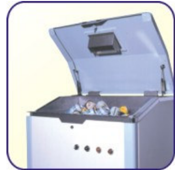
集中處理大量投入材質