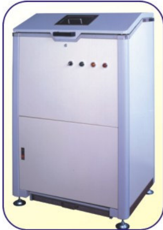
鋁鐵罐自動壓縮分類回收機